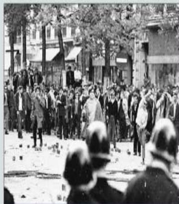
Les manifestations à Paris, mai 1968